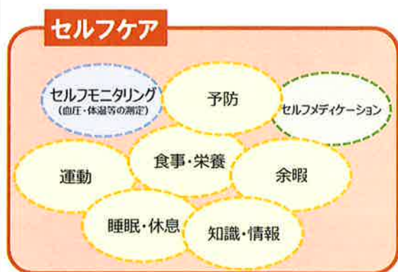
◆図1：セルフケアは広い概念